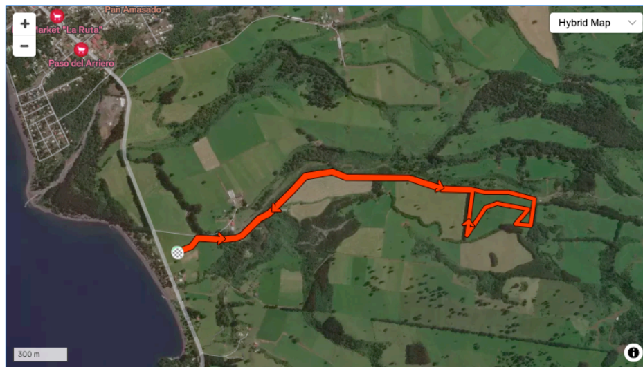
Route and Elevation